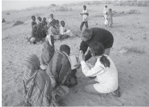
ภาพที่ 2 การเก็บข้อมูลผู้สูญหาย (Ante mortem Data)