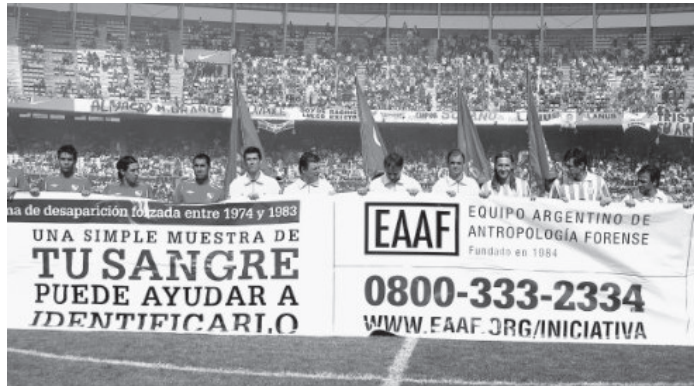
ภาพที่ 5 การประชาสัมพันธ์เพื่อให้ได้ข้อมูลผู้สูญหายจากญาติ

ที่พบ เป็นการเพิ่มช่องทางโอกาสการพิสูจน์ศพ นิรนามให้ประสบความสำเร็จมากยิ่งขึ้น