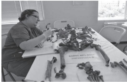
ภาพที่ 4 การวิเคราะห์กระดูกในห้องปฏิบัติการ

4. The identification process และ the integrated report การพิสูจน์อัตลักษณ์บุคคลและการบูรณาการในการออกรายงาน ในขั้นตอนนี้ผู้เชี่ยวชาญด้านนิติวิทยาศาสตร์ที่เกี่ยวข้องในการเก็บกู้ซากศพ การวิเคราะห์กระดูกควรรวบรวมผลการวิเคราะห์ข้อมูลลงในรายงานฉบับเดียว ลักษณะบูรณาการ (Integrated Experts Report) เพื่อส่งไปยังอัยการหรือผู้พิพากษาที่รับผิดชอบในการสอบสวน หากเป็นคดีอาญา (Fondebrider, 2020, pp. 12) การพิสูจน์อัตลักษณ์บุคคลจำเป็นต้องมีข้อมูลทั้งหมดเกี่ยวกับสิ่งที่บุคคลที่ค้นหาเมื่อยังมีชีวิตอยู่ ซึ่งก็คือข้อมูล AM ไม่ใช่เฉพาะข้อมูลจากซากศพเท่านั้น ดังนั้น กระบวนการระบุตัวตนควรพิจารณาข้อมูลผู้สูญหาย เพื่อนำมาเปรียบเทียบกับข้อมูลศพ คือ การวิเคราะห์ซากศพและหลักฐานที่เกี่ยวข้อง เช่น เสื้อผ้าหรือของใช้ส่วนตัว ในขณะที่การวิเคราะห์ทางพันธุกรรมสามารถมีบทบาทสำคัญในการระบุตัวตน แต่ก็อาจพบปัญหา DNA ที่เสื่อมสภาพ หรือปนเปื้อน ผลการวิเคราะห์