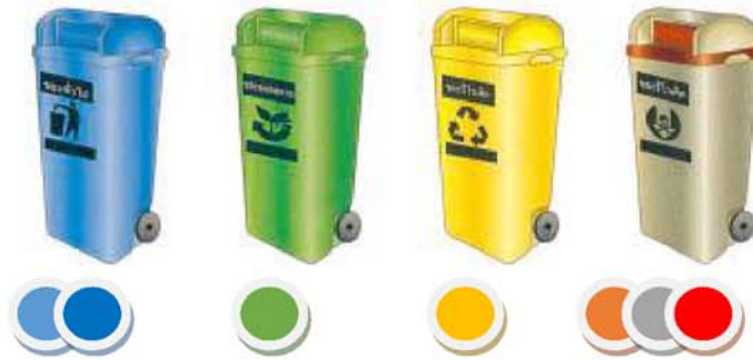
สติกเกอร์สีแปะสินค้า

และความรวดเร็วในการทิ้งขยะ และจัดให้มีถังขยะแยกประเภทที่มีสีให้ตรงกับประเภทของสติกเกอร์ที่ติดบนสินค้าให้เพียงพอกับปริมาณขยะในทุก ๆ ชุมชน และให้มีการ เป็นต้น